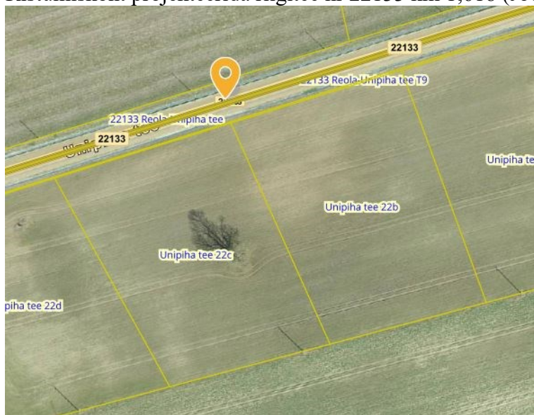
Joonis 1. Riigitee nr 22133 km 1,618, väljavõte Maa-ameti geoportaalist